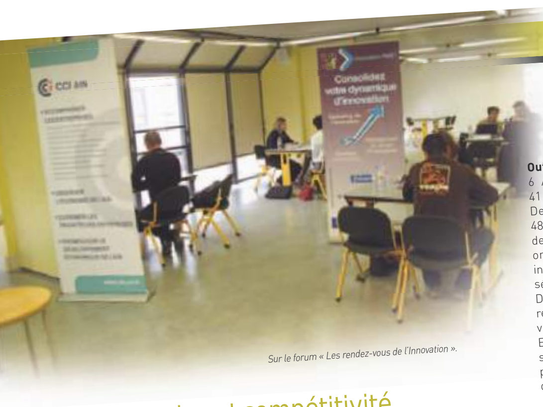
Sur le forum « Les rendez-vous de l'Innovation ».

10 000 conseils individuels, 47 000 rendez-vous dans les entreprises