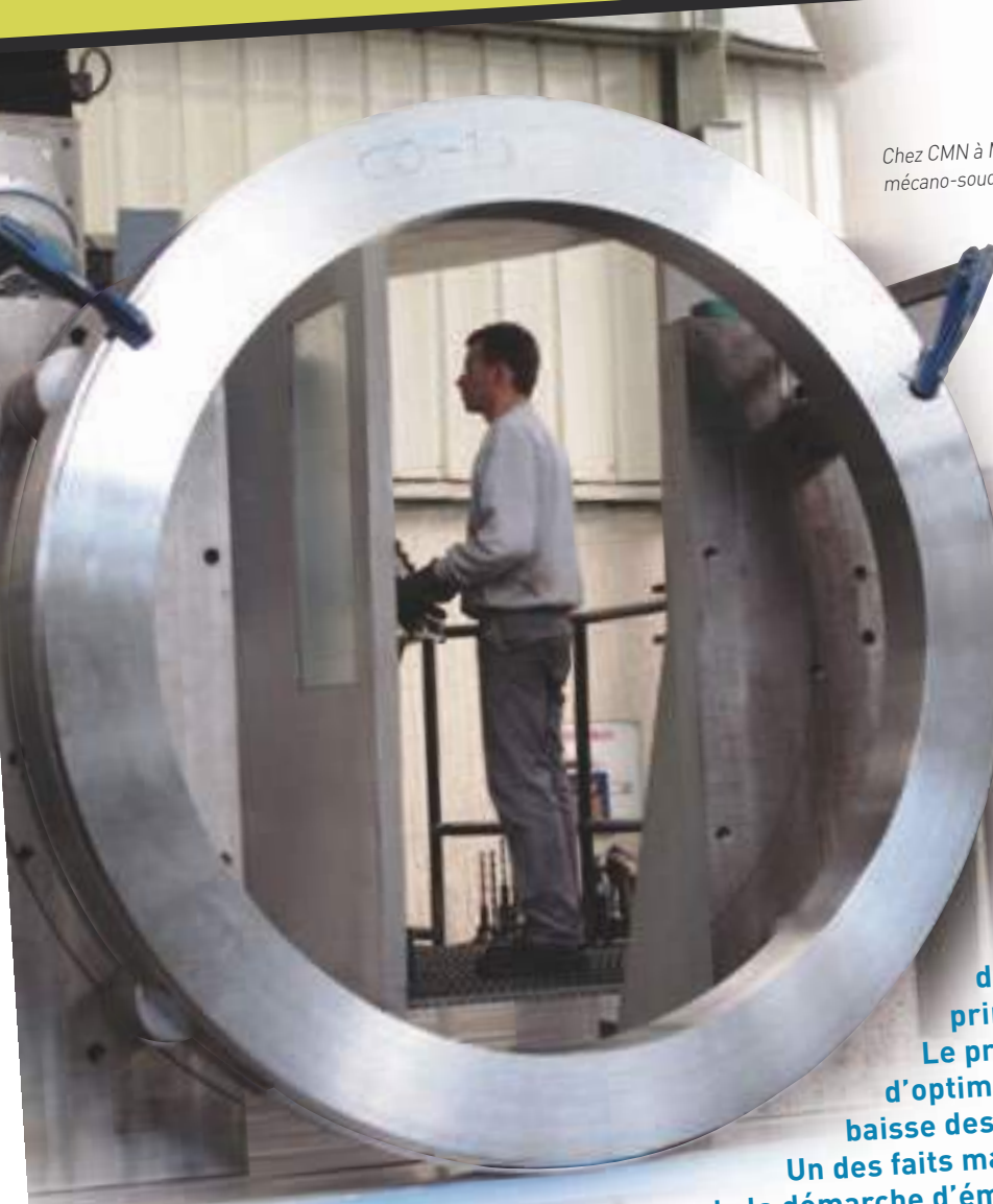
Chez CMN à Miribel, chaudronnerie, mécano-soudure.

Tandis qu'en 2014, la CCI affichait 25 ans d'accompagnement des entreprises en matière d'innovation, le Groupe Projet Industrie a défini sa stratégie dans le cadre de « 2014, année de l'innovation », thème du réseau national des CCI, avec plusieurs temps forts dont l'Assemblée annuelle de septembre et les « Trophées de l'Innovation 2014 CCI de l'Ain » sous le parrainage de l'INPI. Plus que jamais, les actions ont été organisées en privilégiant la proximité et la transversalité des réponses aux besoins détectés, notamment dans le cadre du PAE ® Parcours d'Accompagnement de l'Entreprise, avec la poursuite des contacts terrain et de la réalisation des prédiagnostics dans les principaux axes du développement des entreprises. Le programme a pris en compte la nécessité d'optimiser le montage des actions dans un contexte de baisse des ressources fiscales.