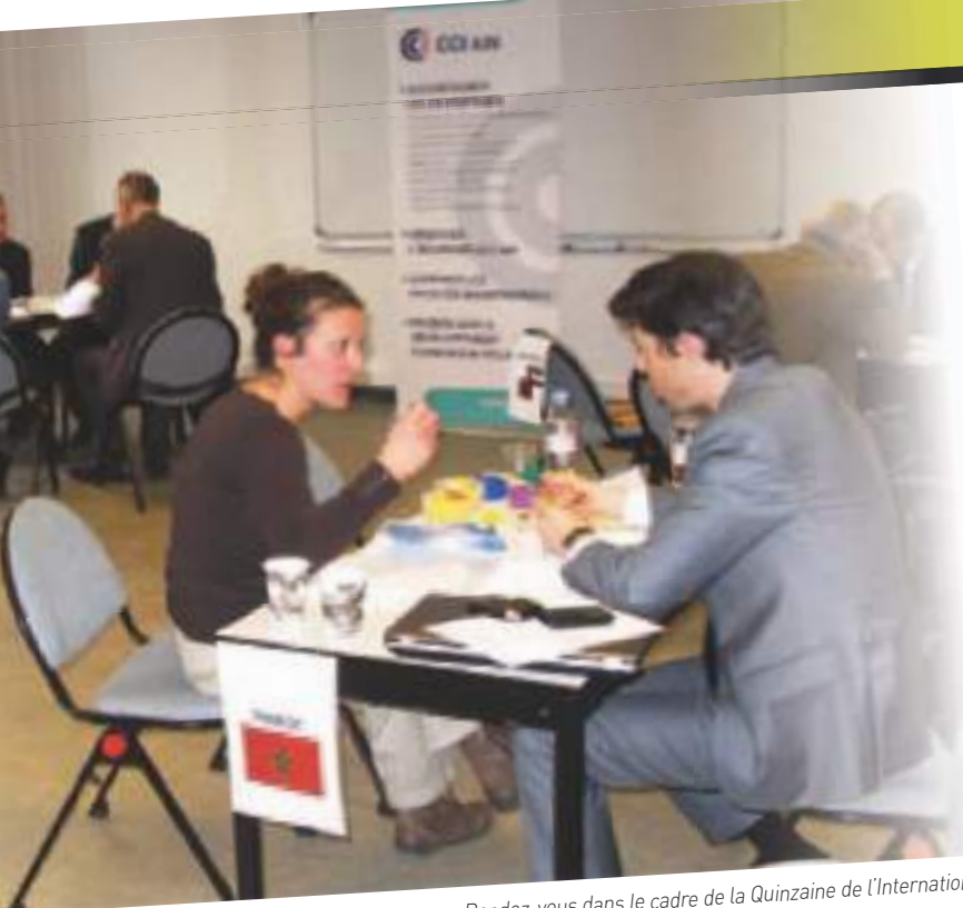
Rendez-vous dans le cadre de la Quinzaine de l'International.