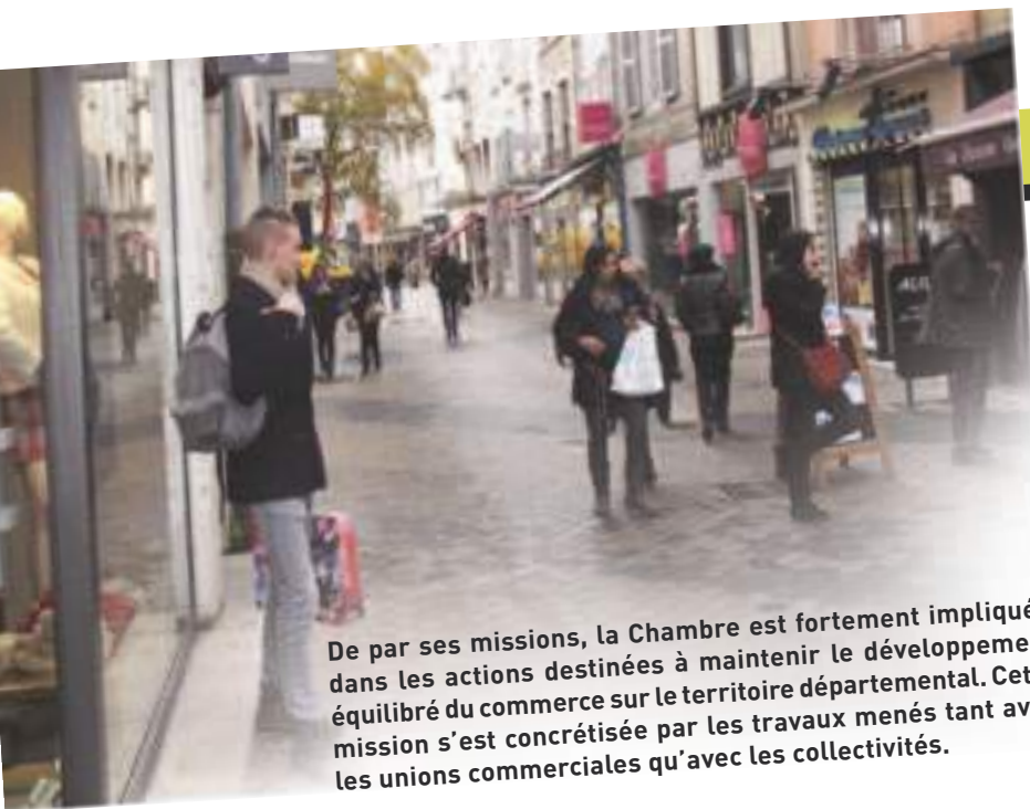
Centre-ville de Bourg-en-Bresse.

De par ses missions, la Chambre est fortement impliquée dans les actions destinées à maintenir le développement équilibré du commerce sur le territoire départemental. Cette mission s'est concrétisée par les travaux menés tant avec les unions commerciales qu'avec les collectivités.