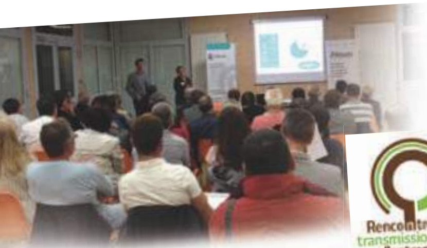
Conférence des Rencontres de la transmission à Villars-les-Dombes, le 6 octobre.

2 400 chefs d'entreprises de plus de 50 ans sensibilisés