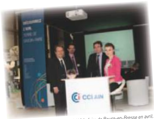
Sur le stand de la CCI à la foire de Bourg-en-Bresse en avril.

RESTEZ CONNECTÉ SUIVEZ L'ACTUALITÉ ÉCONOMIQUE DE VOTRE TERRITOIRE