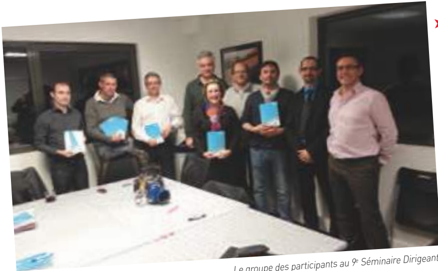
Le groupe des participants au 9 e Séminaire Dirigeants.