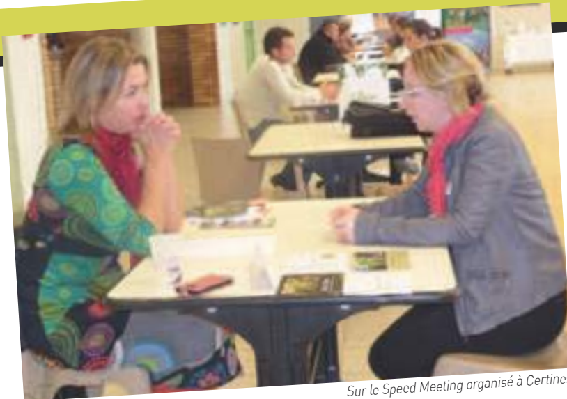
Sur le Speed Meeting organisé à Certines.