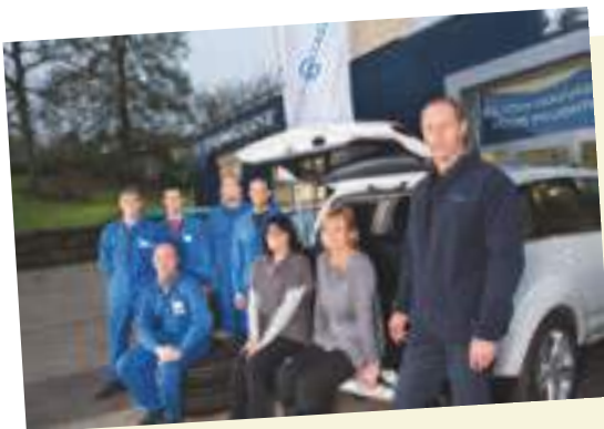
Grand Angle 01 N° 36 - Janvier 2014

l'un des lauréats du premier concours de vitrines.