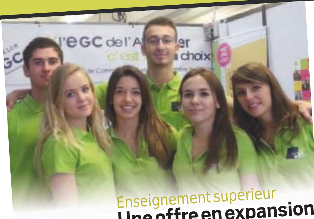
Un groupe d'étudiants de l'EGC sur le forum Campus 01.