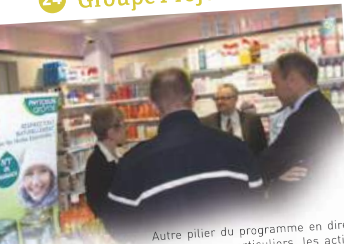
Visite conseil-sécurité à Miribel.