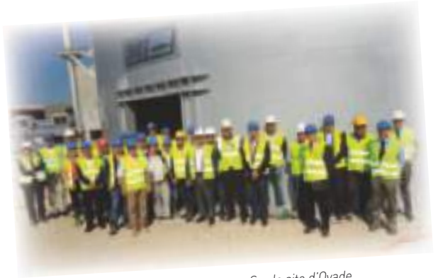
Sur le site d'Ovade.

en matière de gestion des déchets. Le nouvel équipement s'inscrit dans le Plan départemental des déchets non dangereux piloté par le Conseil général et dont la Chambre est membre de la commission consultative d'élaboration et de suivi.