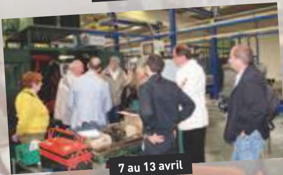
7 au 13 avril