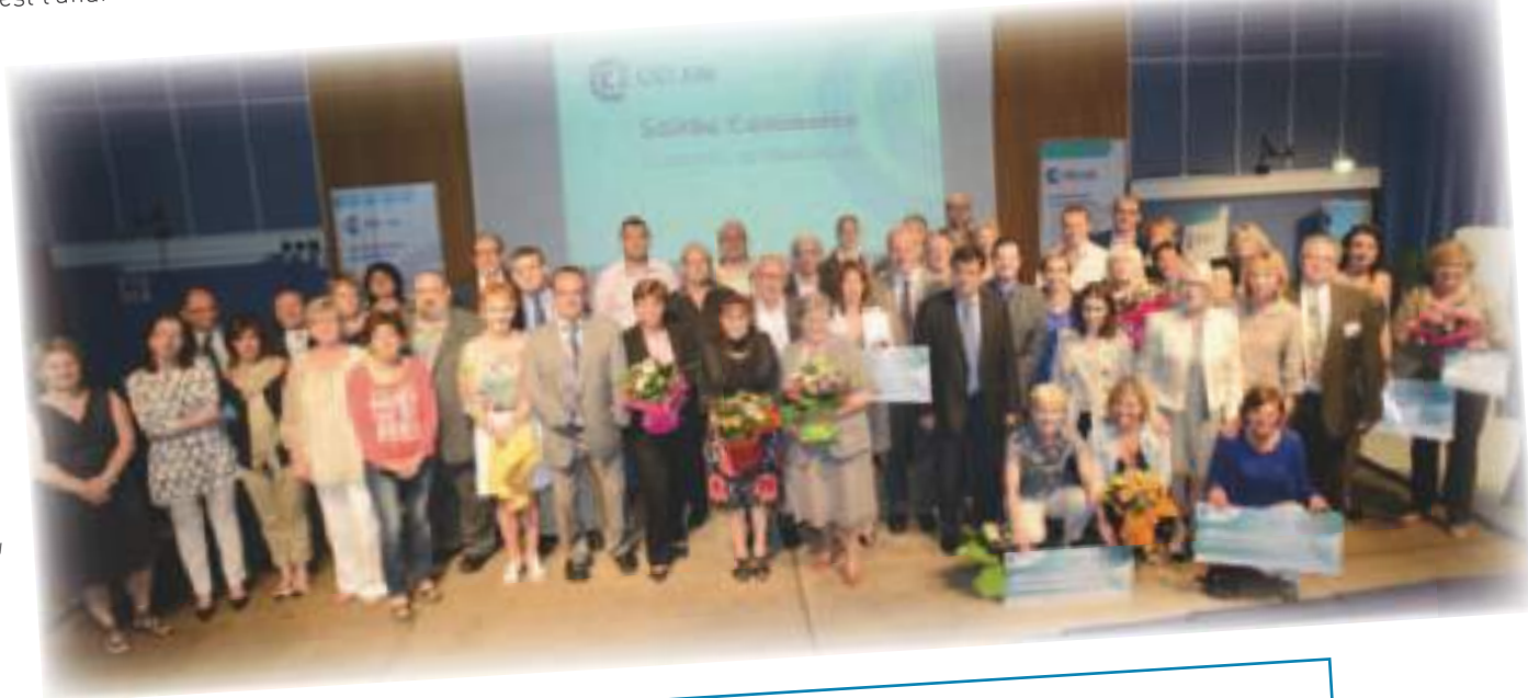
Les lauréats du 17 e Challenge des unions commerciales.

3 e catégorie: Pôle du Commerce de la Plastics Vallée Yonnax (1 er prix), UCAB Belley, ACA Miribel, Ambérieu Vittrines. L'UCAP Pont-de-Vaux a obtenu le prix spécial « À deux pas » et LECAP Lagnieu le « Trophée André Guillermier ».