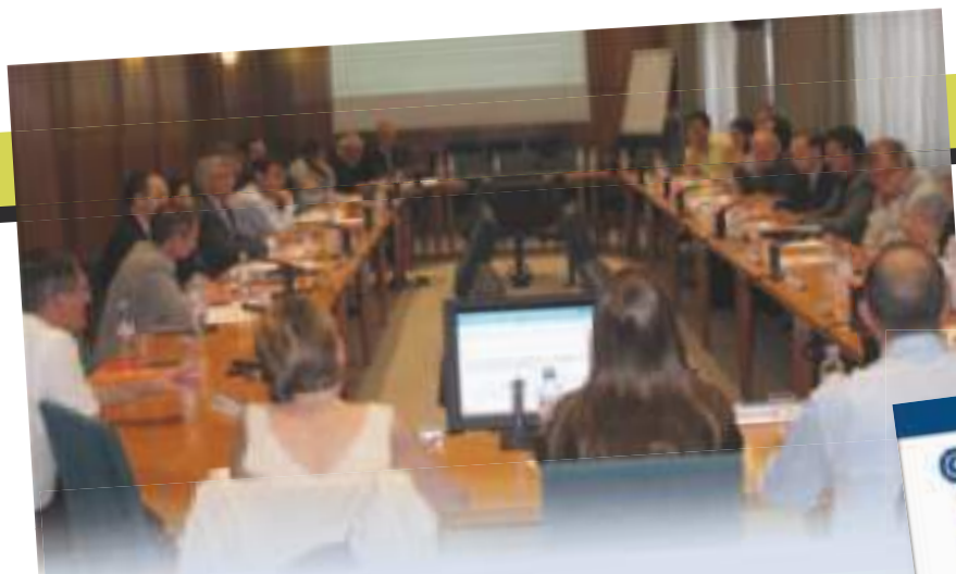
Réunion du Groupe Projet Industrie le 10 juillet.