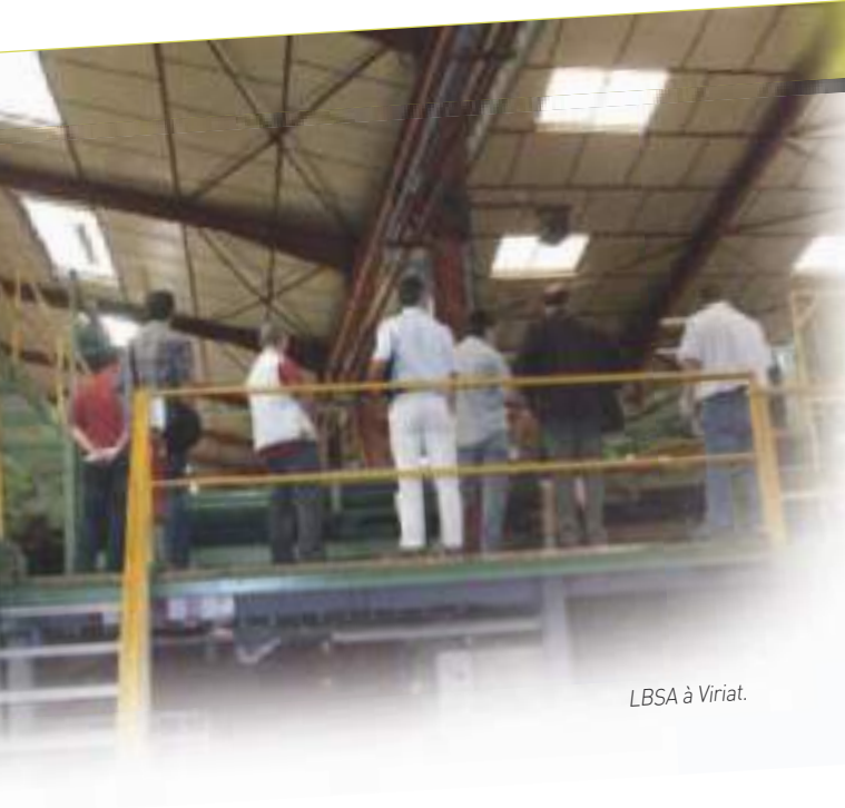
LBSA à Viriat.