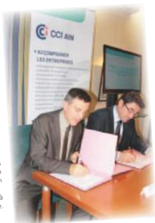
Le Président Bailly et le Président Bruyère signent la convention entre la CCI et le CETIAT.

La mobilisation de ces acteurs a d'ores et déjà permis de doter la filière d'une plaquette de communication disponible en français et en anglais, sous le titre « L'Ain ne manque pas d'air ». En présentant les métiers du pôle d'excellence, il s'agit de lui donner plus de visibilité et d'assurer sa promotion notamment auprès des jeunes en formation. Un volet formation est en cours. Le Pôle d'excellence AFT de l'Ain était présent sur le Forum Ain'formations métiers du 5 au 7 mars 2015. Par ailleurs, la Chambre a signé avec le CETIAT une convention de partenariat qui vise à accroître l'accès des entreprises de l'Ain aux services proposés par le centre technique.